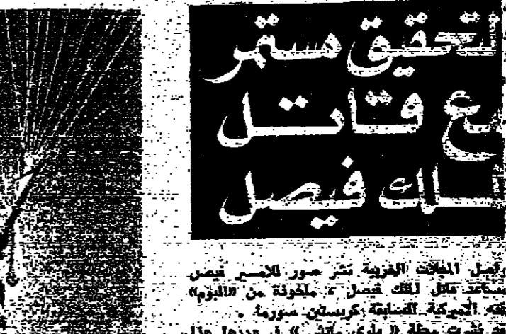
القتل ببيط بالخلة اثناء وجوده في أمريكا

قالت مصادر فلسطينية مطلعة «للانوار» امس، ان السيد ياس عرفات الذي ابلغ الرئيس انور السادات امس الاول موقفه من عملية التحرير من حضور مؤتمر جنيف، سيجتمع مع الرئيس الفرنسي جيسكار ديستان في الجزائر هذا الاسبوع وسيدنا تستأن زيارة للعاصمة الجزائرية غدا وتستمر ثلاثة ايام. وقالت المصادر ان القبة الفلسطينية - الفرنسية كان من المتوقع ان تتم في باريس بعد دعوة عرفات لزيارته، ولكن اتفق على ان تتم في الجزائر بمناسبة زيارة الرئيس الفرنسي لها. وياني هذا الاجتماع قبل الجولة العربية التي ينتظر ان يبدأها الرئيس